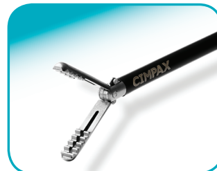
C-CLINCH 22 mm jaw lengte