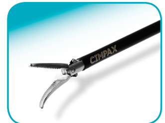
C-DISSECT 20 mm jaw lengte