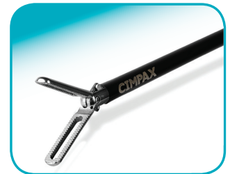
C-GRASP 22 mm jaw lengte