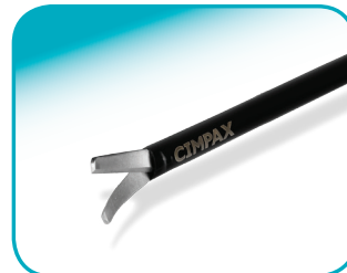
C-CUT 17 mm blad lengte