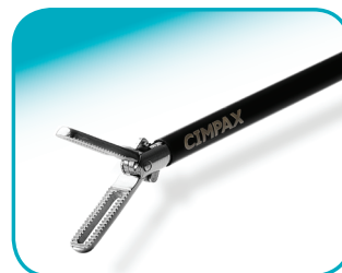
C-GRASP 18 mm jaw lengte