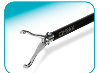
C-BAB 22 mm jaw lengte